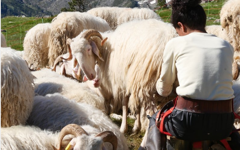
Créditos de fotos : (Piau Engaly)