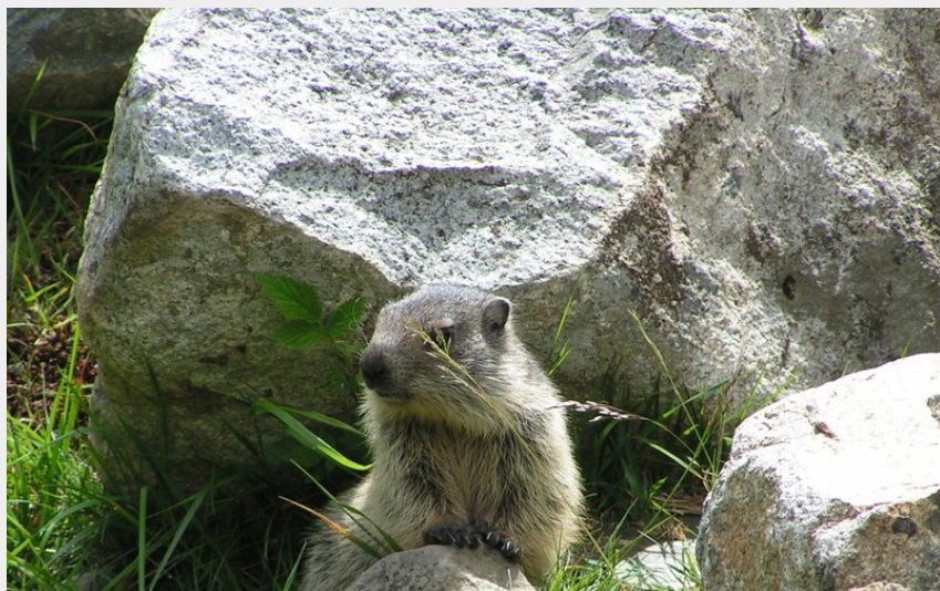
(Sentier des marmottes)