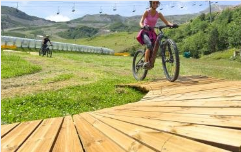
Parcours d'initiation VTT (Piau Engaly)