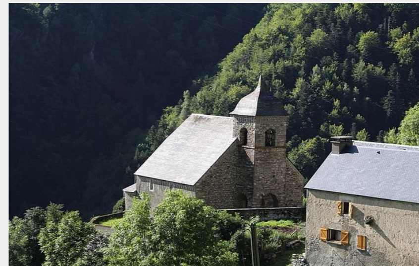
(Chemin du Bédat)