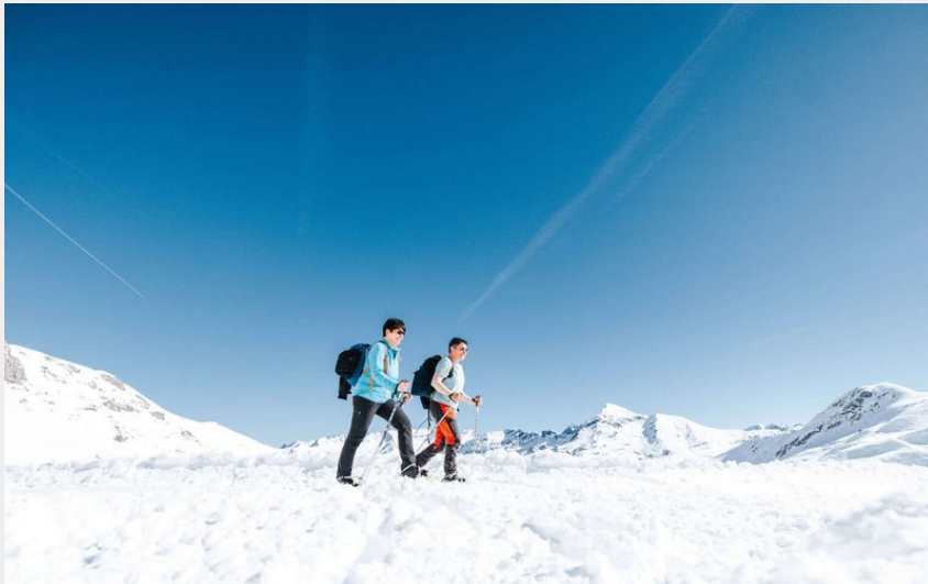
Crédit : Parcours raquettes n°6 ((c) Station de ski Gavarnie-Gèdre)