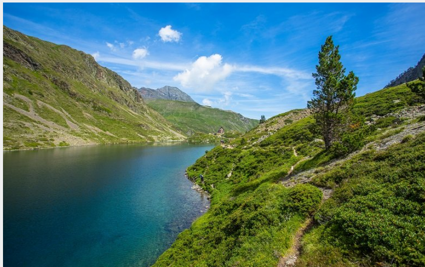
Lac d'Ilhéou