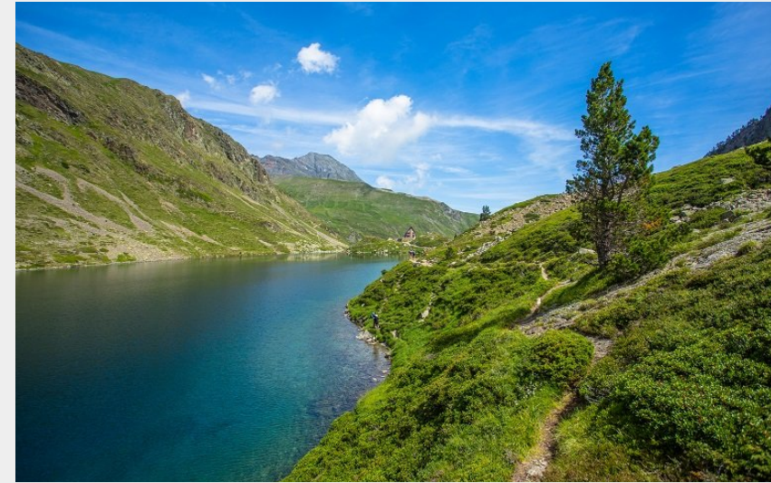
Lac d'Ilhéou