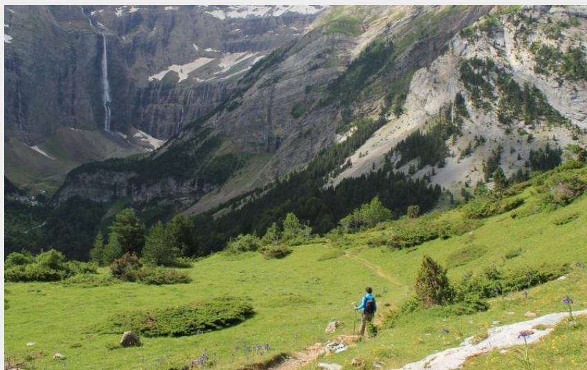
Le plateau de Bellevue