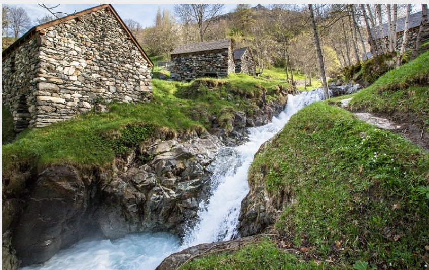
Les moulins de Gèdre-Dessus