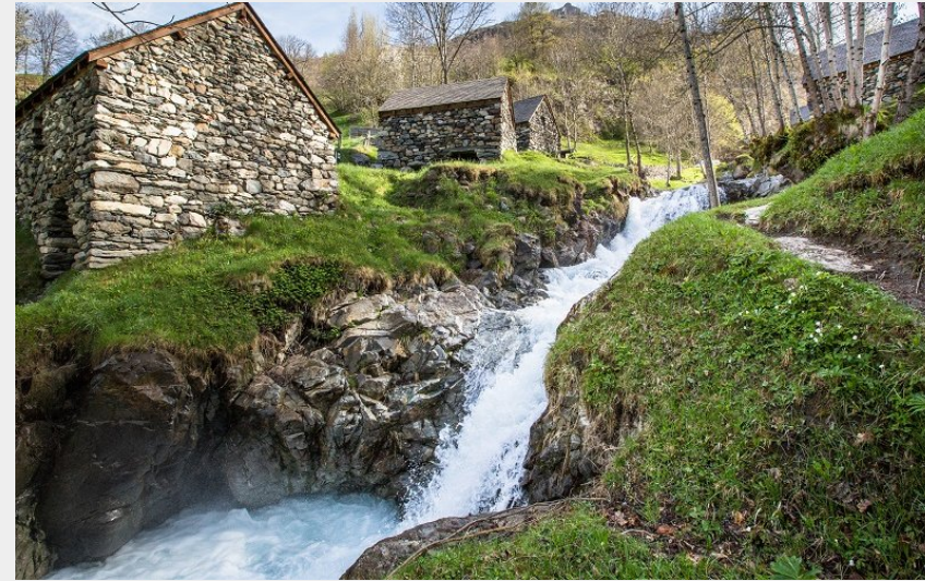
Les moulins de Gèdre-Dessus