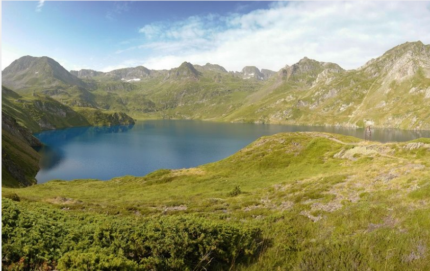
Le lac bleu (Wendy LESNIAK)