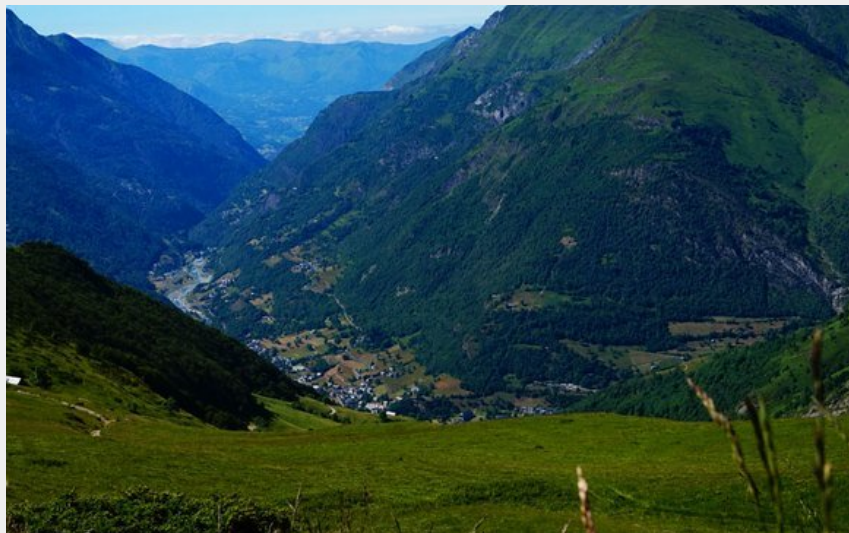
Les estives du Bergons