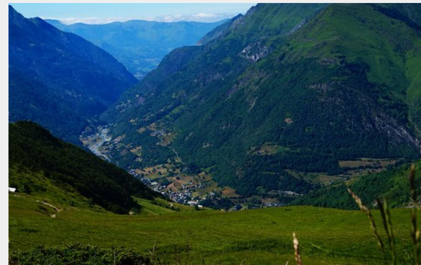
Les estives du Bergons

Vallée de Luz-Saint-Sauveur - Luz-Saint-Sauveur