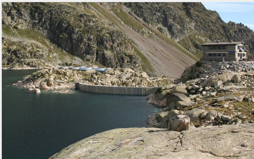
Lac et refuge de Migouélou