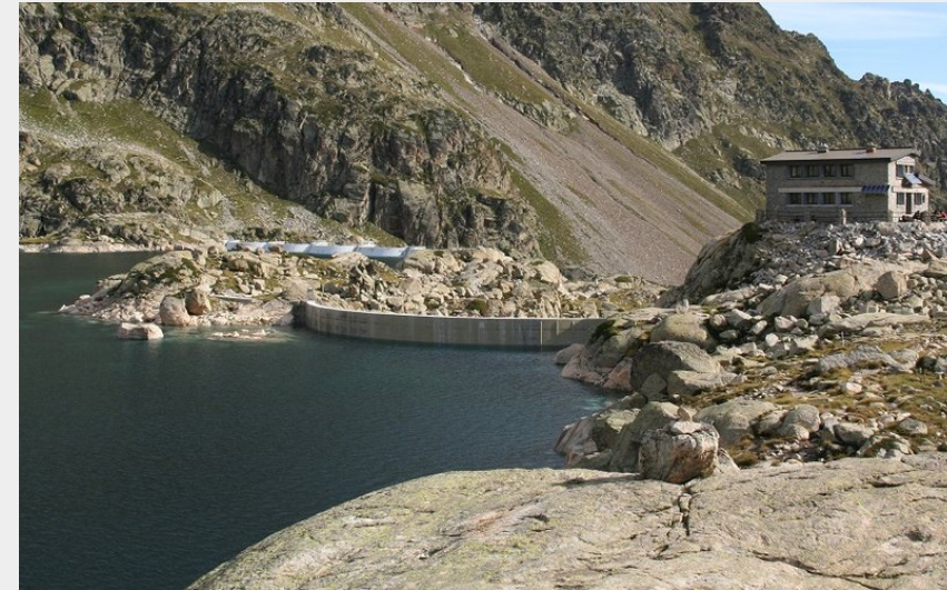
Lac et refuge de Migouélou