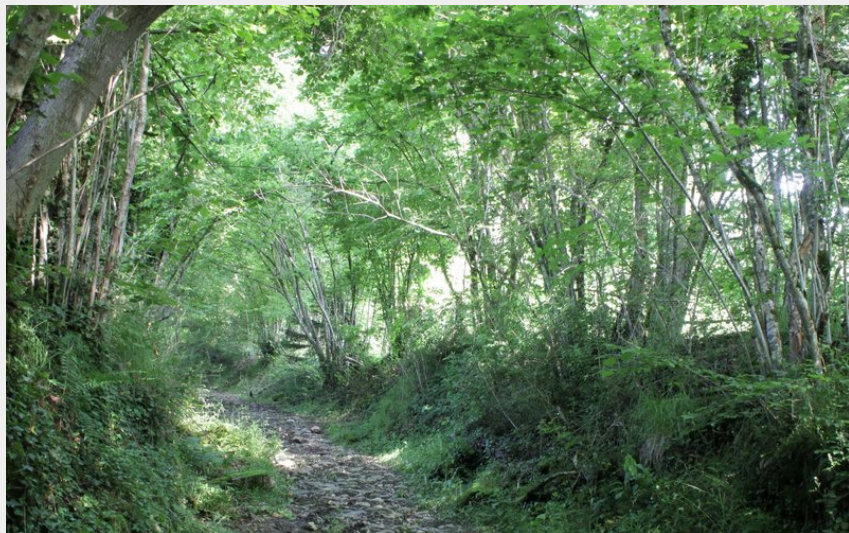
Montée ombragée dans un "chemin creux"