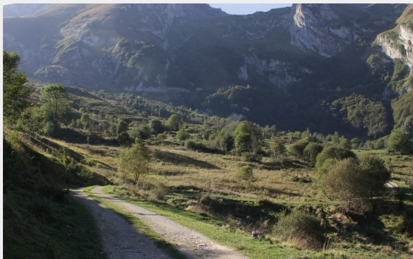
Le cirque du Litor