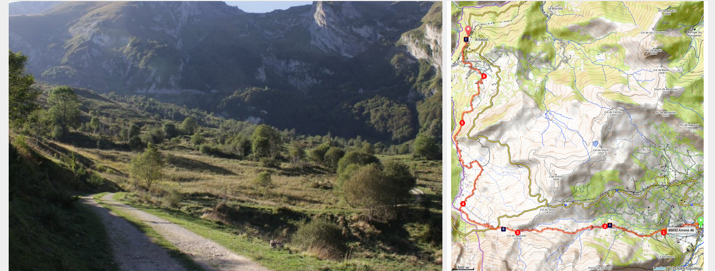
Le cirque du Litor (c) Julien Liron