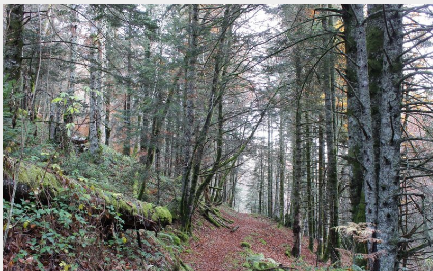
Forêt montagnarde sous le Haugarou