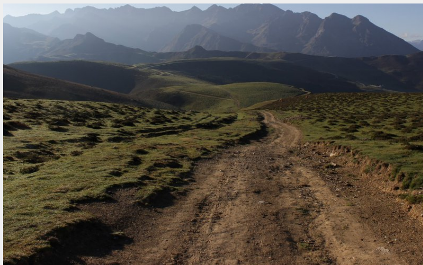
Lumière matinale sur les estives du Hautacam