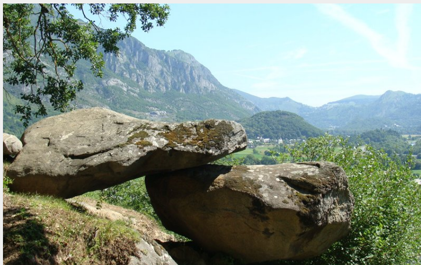
Les pierres du Balandrau