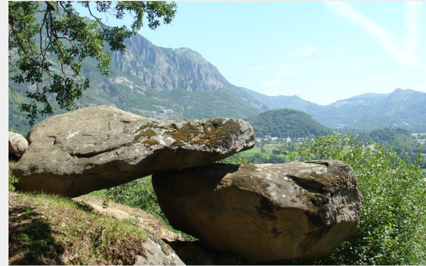
Les pierres du Balandrau