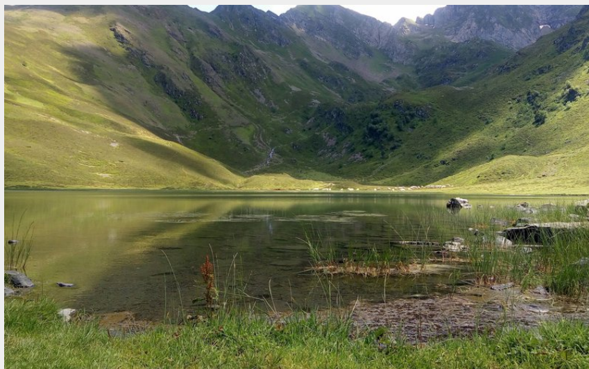
Lac d'Isaby