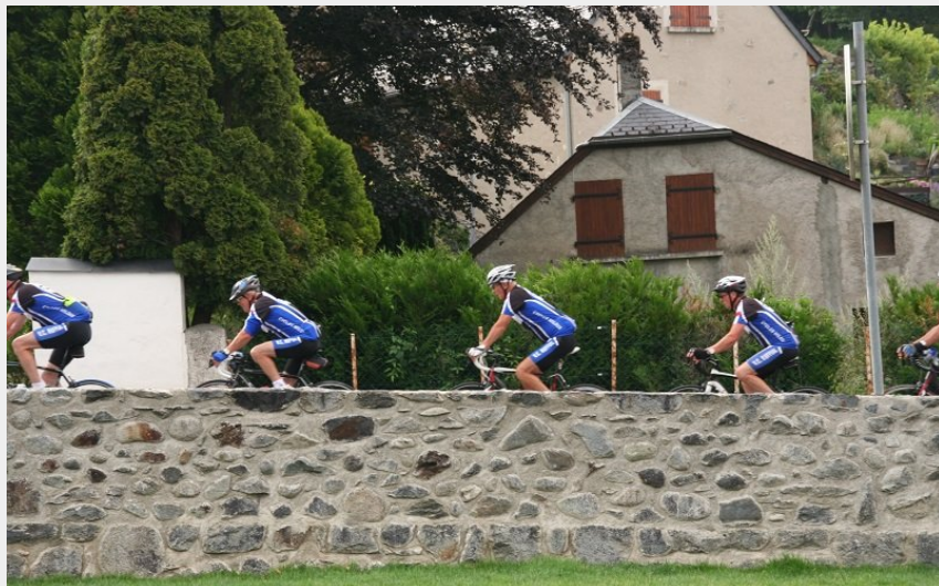
Découverte des villages Toy à vélo