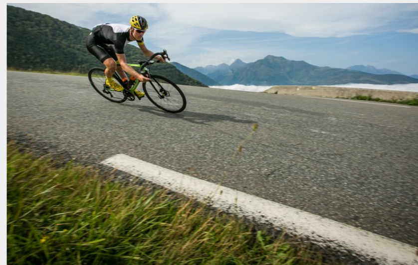
(Col Collective Pyrenees)