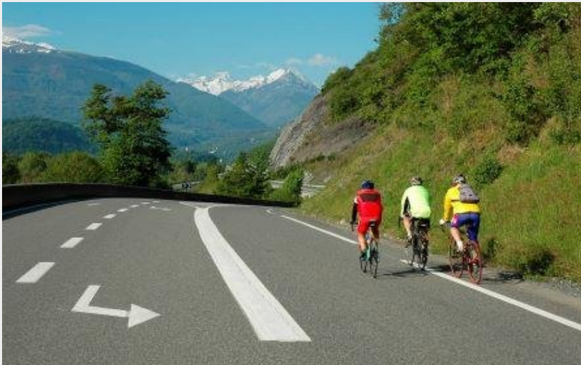
((c) Bruno Valcke)