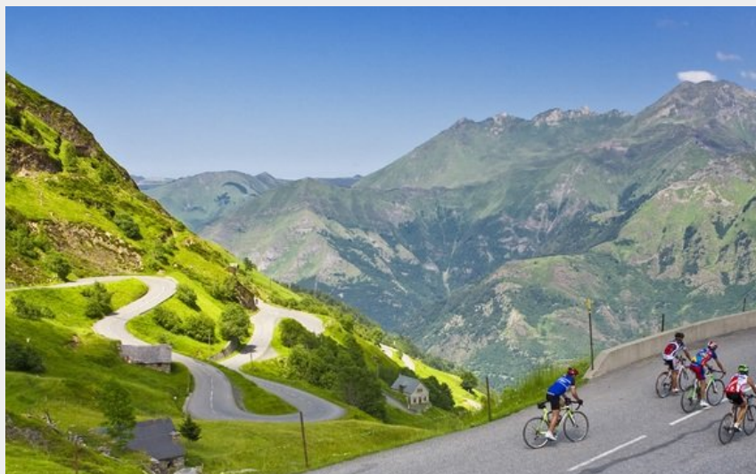
Les virages de Luz-Ardiden