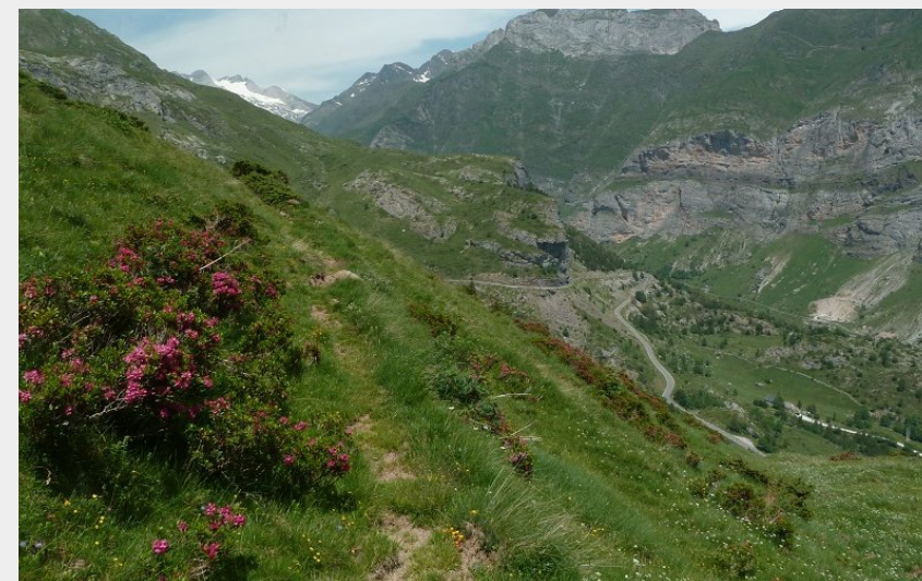
Vue sur le massif du Vignemale (J.Liron)