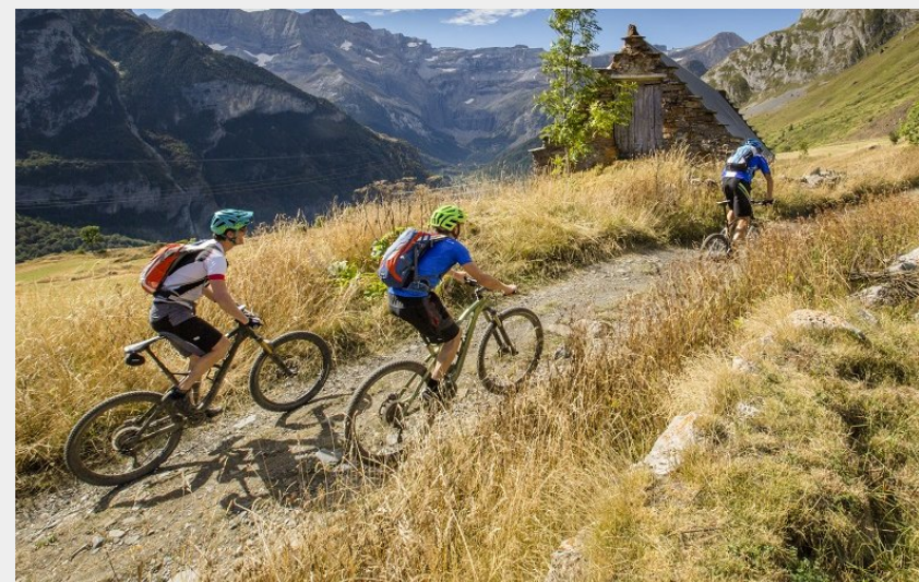
Enduro sur le Plateau de Saugué (Pierre Meyer)