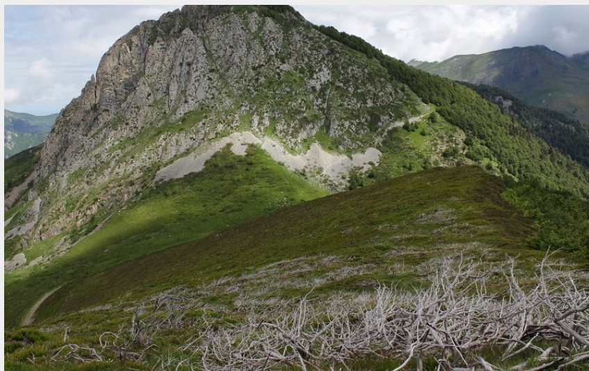
Le pic depuis les abords du col de Bazès (Julien Liron)