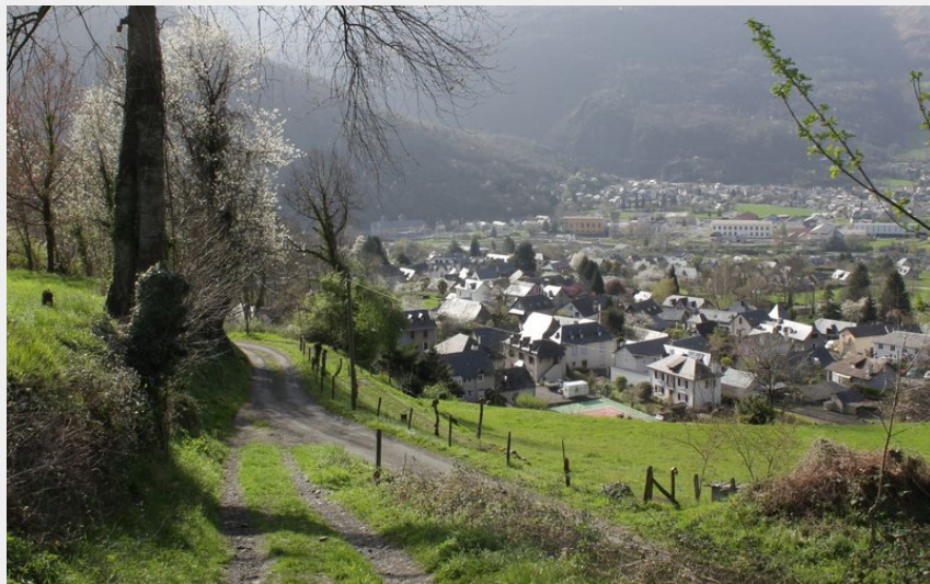
Vue sur Villelongue et la vallée