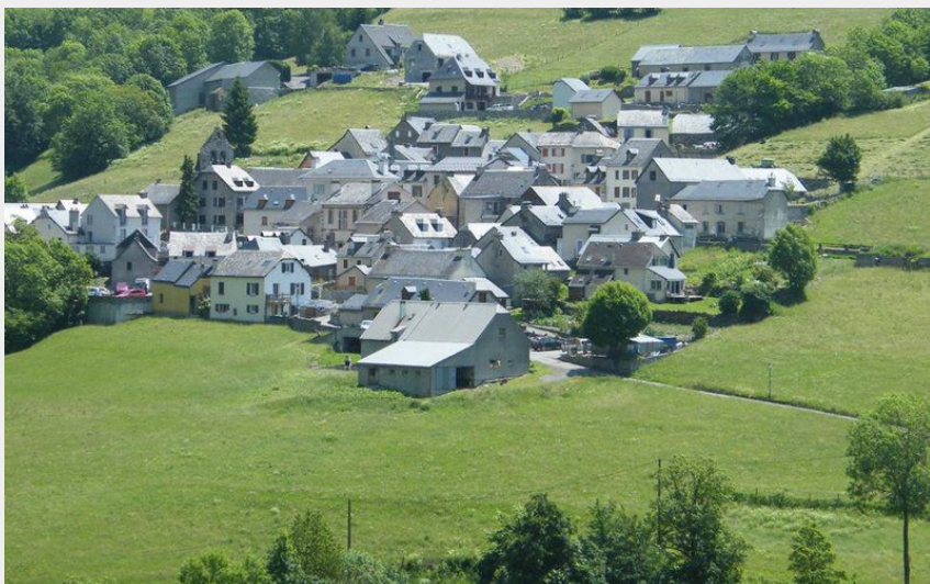
Village de Betpouey (Pierre Meyer)