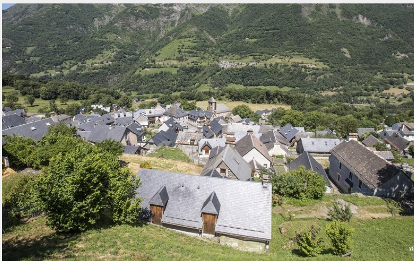
Vue sur la vallée de Luz (Pierre Meyer)