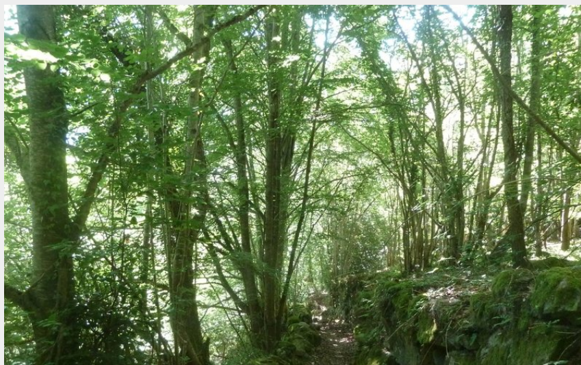
Superbe descente en sous-bois