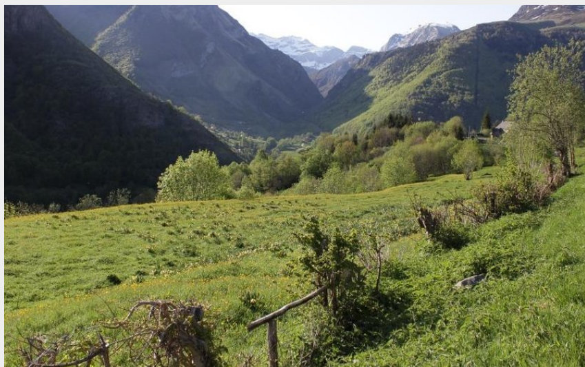
Vue sur la vallée depuis Ayruès (Julien Liron)