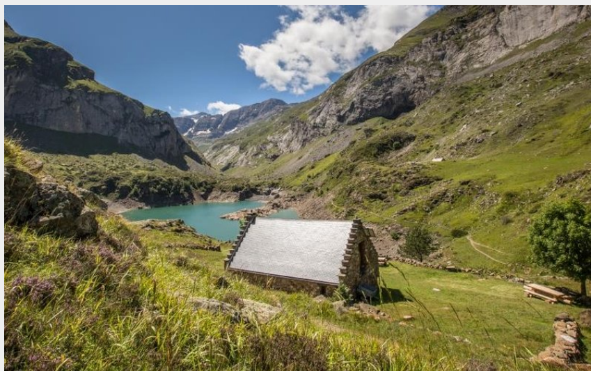
Le lac des Gloriettes (Pierre Meyer)