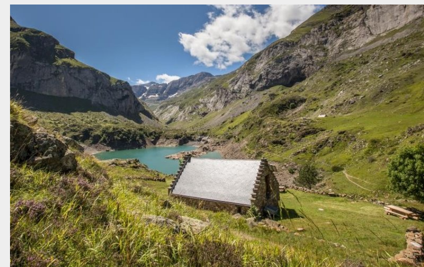
Le lac des Gloriettes (Pierre Meyer)