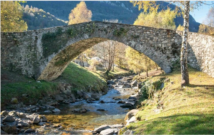
Pont d'Arrens