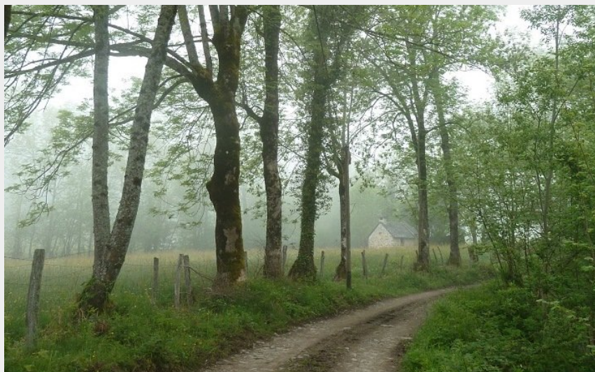
Piste du Bergons