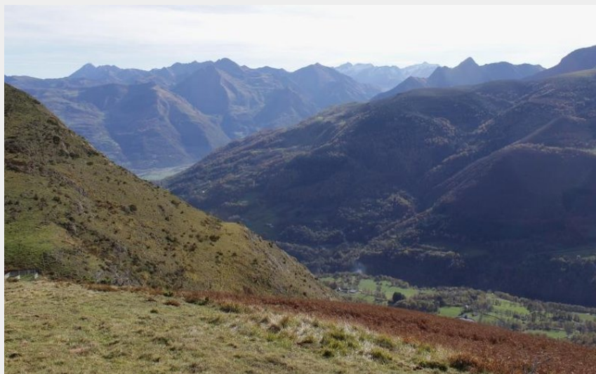
Le col de Liar