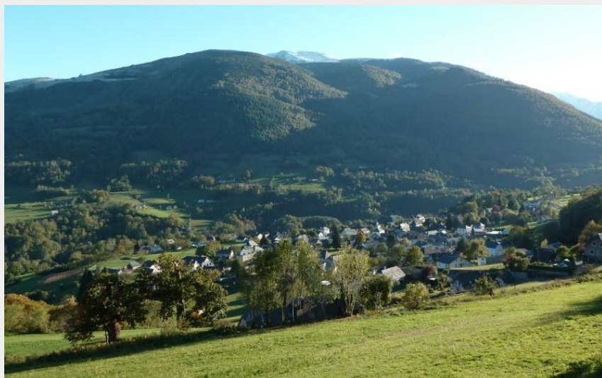
Arras-en-Lavedan (Julien Liron)