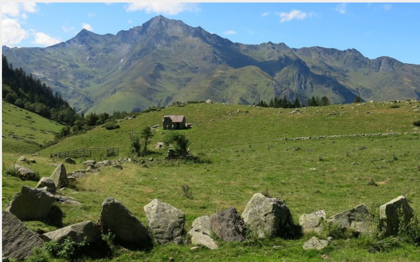
Le plateau du Lisey