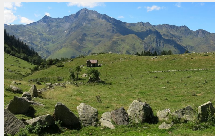
Le plateau du Lisey