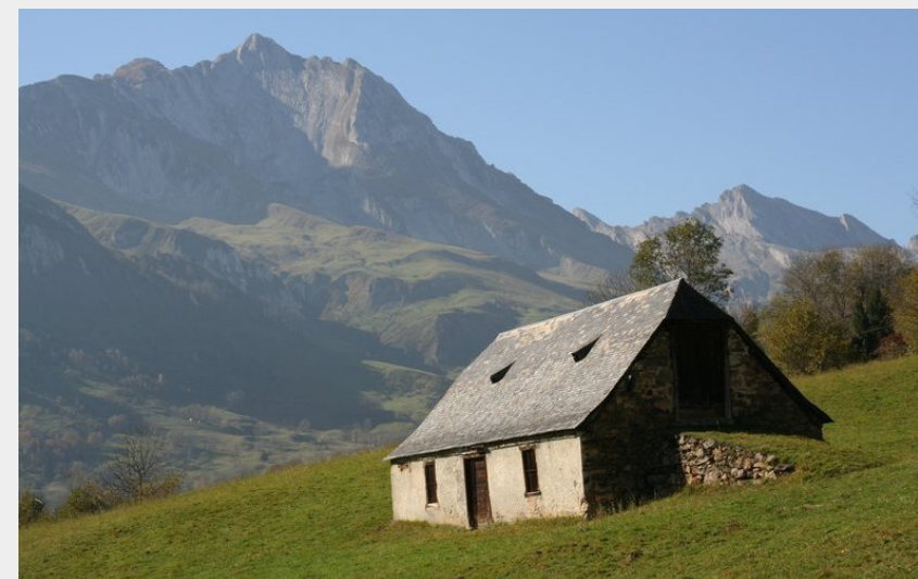
Grange aux Artigaux