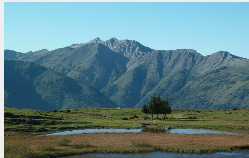
Le lac de Soum