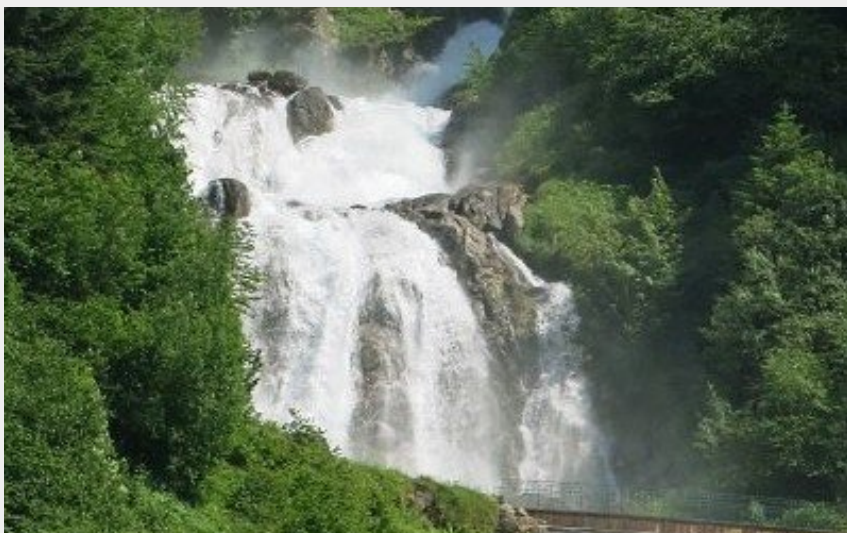
Cascade de Lutour