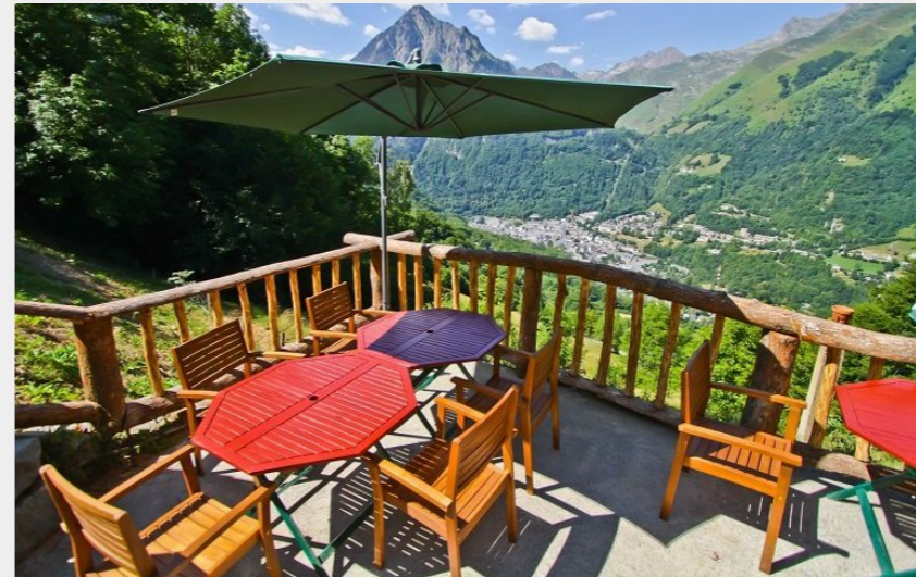
Panorama depuis la Reine Hortense