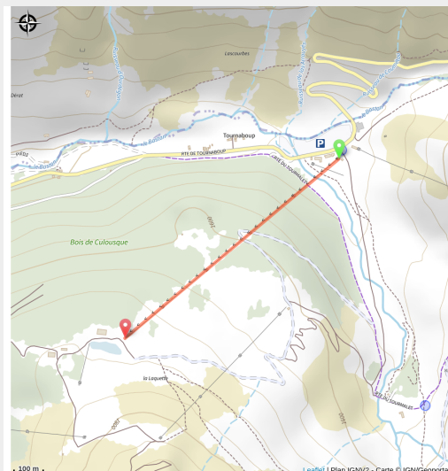
Bike Park de Barèges fermé en 2026