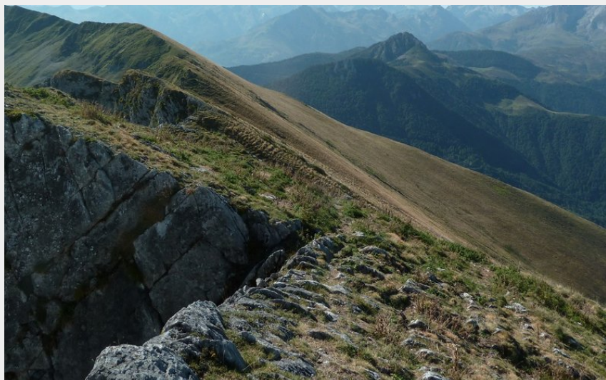
Depuis le sommet du Pic de l'Estibète