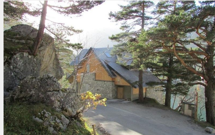
Refuge d'Orédon